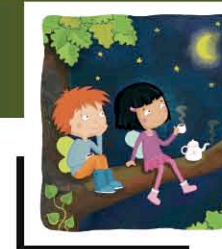
Was für ein Wetter! (Judit Berg) Illustration: Panka Pásztohy